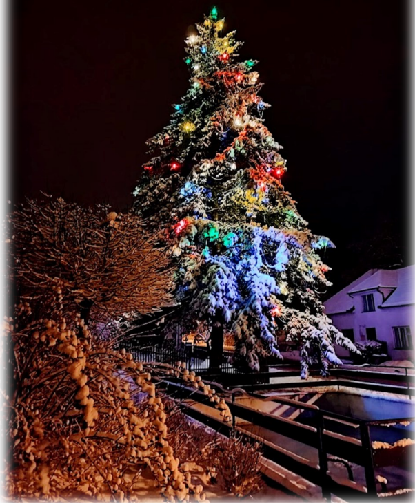
zrnecký strom o první adventní neděli

Přesto ale těšíme se velice, na krásné a milostivé Vánoce.